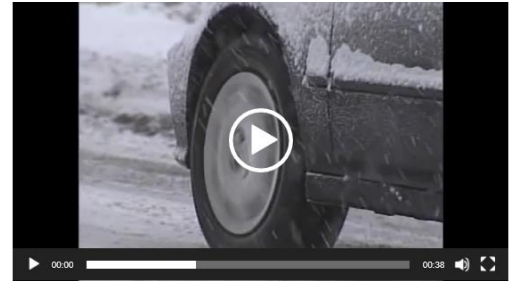
Intitulé : Accident de voiture a mourir de rire snow and cars crash / Durée : 0.37min / Réf. SeRCV009 / Source : Non connue