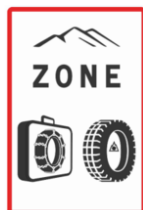
Entrée de zone

Depuis le 1er novembre 2021, une nouvelle signalisation est implantée. Elle indique les entrées et les sorties de zones de montagne où l'obligation d'équipements hivernaux s'applique. Elle est matérialisée par les deux panneaux ci-dessous :