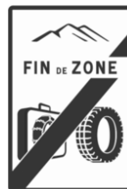
Sortie de zone

Nous restons à votre disposition pour tout complément d'information.