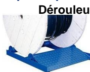
Dériveur Remorque/ Dériveuse