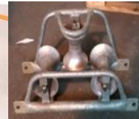
« Diabolo »