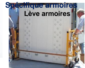
Spécifique armoires Lève armoires