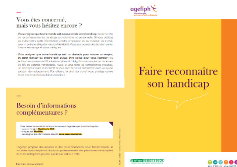
Affiche Intitulé : COMMENT ABORDER LA RQTH Source : Agefiph

Vous trouvez d'autres supports sur : www.travailleurhandicapé.fr