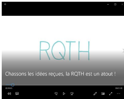
Vidéo Intitulé : CHASSONS LES IDEES RECUS Durée : 1min53 – Source : « Oeth »