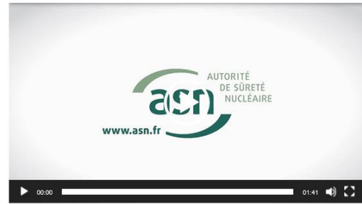
Vidéos sur le Radon et ses risques pour la santé de 1min31 et 1min41.