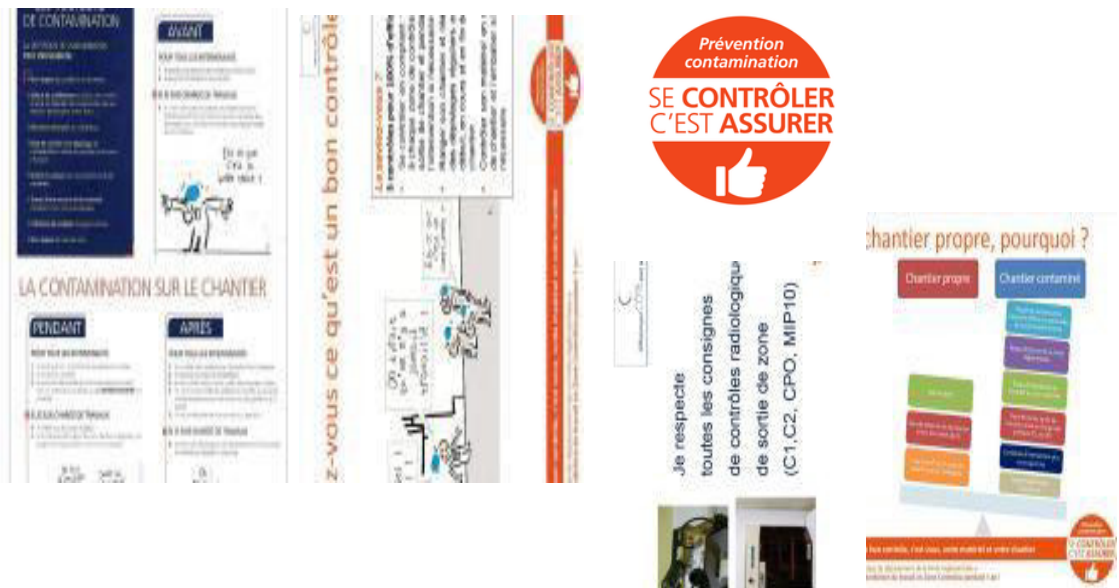
Série de 5 Affiches sur la Contamination