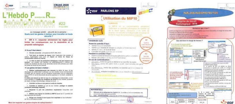
3 Supports sur la contamination, sur le MIP10 et sur le RTR.