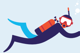
Travail en milieu hyperbare 60 interventions par an