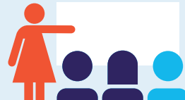
Je suis une formation professionnelle qualifiante

2 points = 50 heures de formation 12 points = 300 heures de formation 20 points = 500 heures de formation