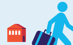
J'anticipe mon départ à la retraite

10 points = 1 trimestre à mi-temps sans réduction de salaire Maximum 8 trimestres (2 ans)