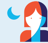
Travail de nuit 120 nuits par an

› A savoir : le dispositif entre en vigueur en 2015 pour ces 4 facteurs et en 2016 pour 6 autres.